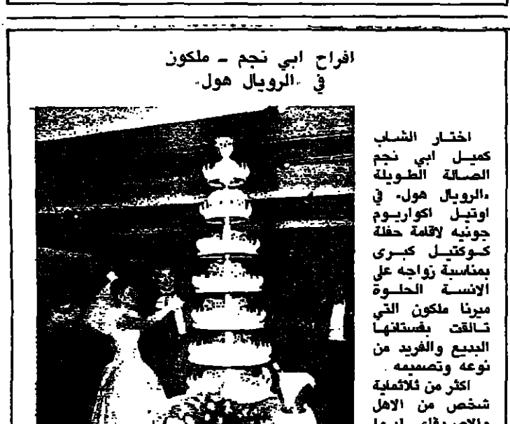
افراح ابي نجم - ملكون في الرويال هول